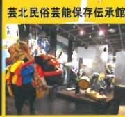
芸北民俗芸能保存伝承館