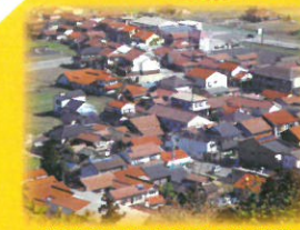
↑壬生城址公園から壬生の町を望む