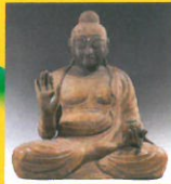
重要文化財 薬師如来坐像

壬生は陰陽の交通の要衝として早くから開けた歴史ある町。花田植公園当日はたくさんの観光客でにぎわうが、だんは静かな商店街。マップ片手にぶらぶら町歩きをし、花田植ギャラリーでひと休みしよう。